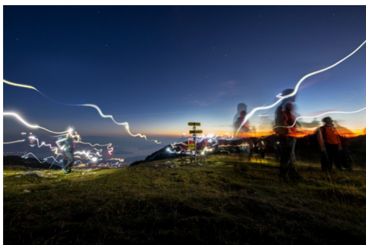
2. Platz RURITAGE Photowettbewerb: Urosh Grabner Karavanke/Karawanken UNESCO Global Geopark, Österreich / Slowenien