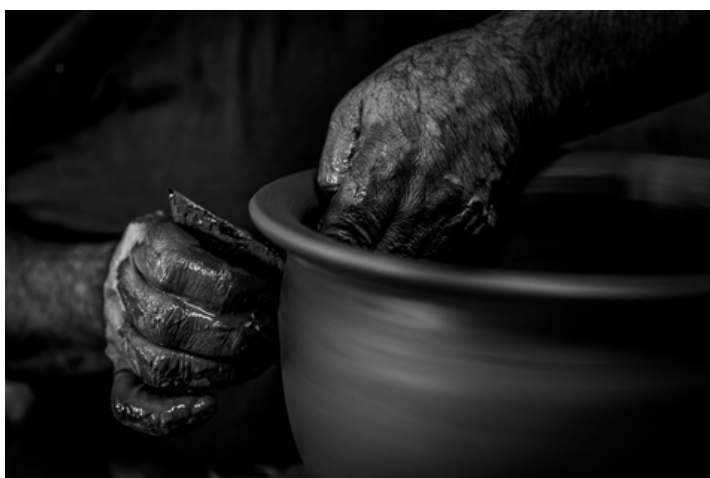
Tretje mesto na RURITAGE fotografskem natečaju: Efstratios Kapetanas Lesvos Island UNESCO Globalni Geopark, Grčija

VEČ INFORMACIJ O DELU, KI GA OPRAVLJAMO, NA DEDIŠČINI OSNOVANI REGENERACIJI PODEŽELSKIH OBMOČIJ